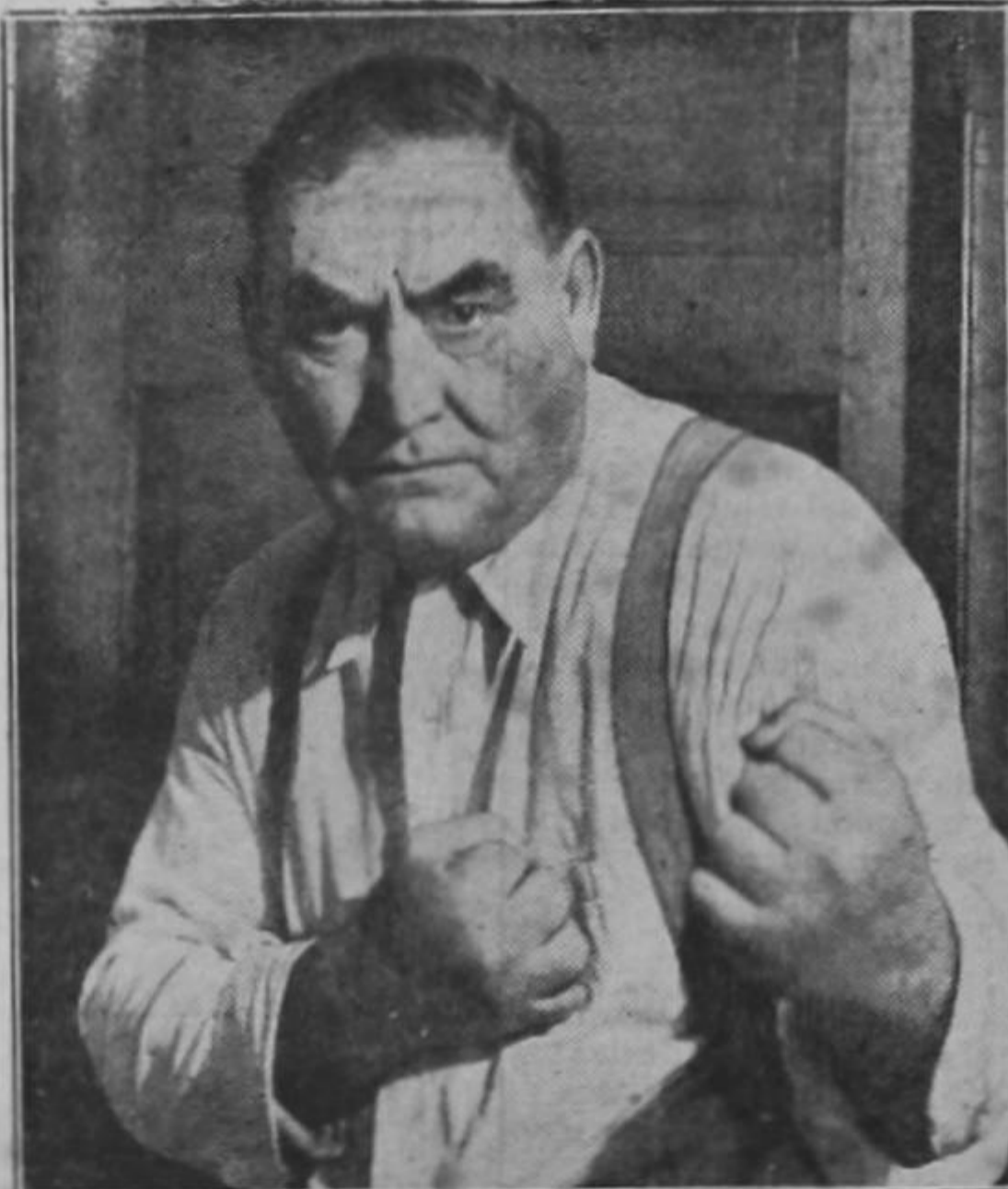
Aquí está el editor responsable de EL BROCHAZO. ¡A ver qué pasa con las aclaraciones...!