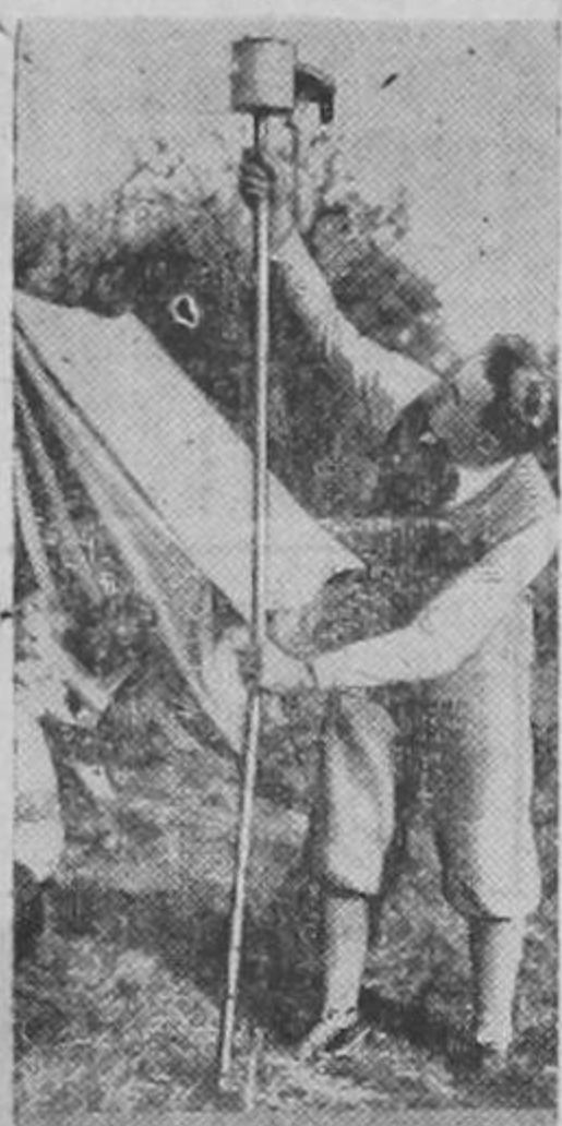
Un fervoroso calderonista tomando medidas para ver a qué distancia queda el «huesillo». (Foto tomada en el patio de una casa).