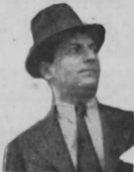
Nuestro joven y egregio candidato viendo para el ciprés. (El ciprés está a la derecha)

Quedan de una vez y por siempre confundidos los enemigos de nuestras gloriosas huestes