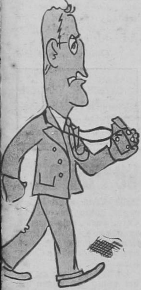
Caricatura de «Dios»